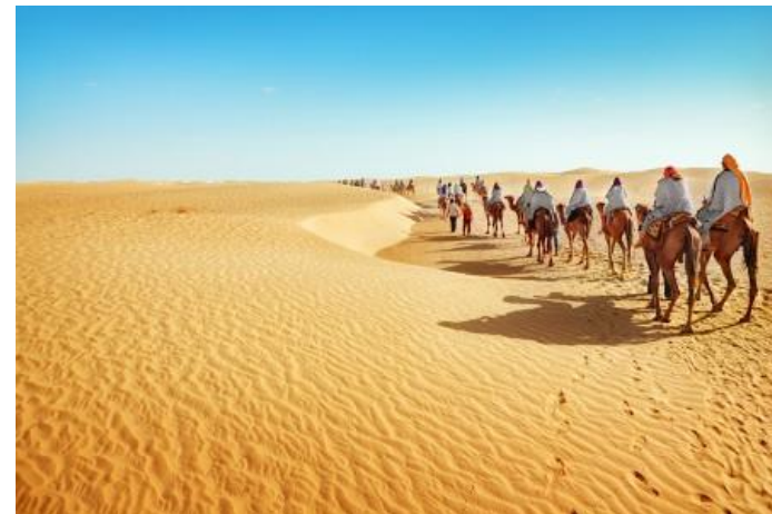
otca! Gn 49, 1-2

Prejsť púšťou si vyžaduje námahu, no nie je to nemožné. Na to, aby sme sa mohli popasovať s touto výzvou, je užitočné uviesť niekoľko rád. Nevzdávať sa od karavány, nevláčiť so sebou zbytočnú záťaž, ale vziať si len niekoľko nevyhnutne potrebných vecí, pozorovať a rozoznávať fatamorgány, vedieť sa orientovať pohľadom na hviezdy, neprestať túžiť po konečnom ciele... a za každých okolností si zachovať úsmev.